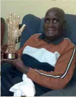
H.E. Dr Kenneth Kaunda