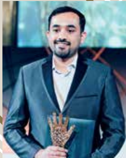
I Paid A Bride

India (Innovation/Investigative Journalism)