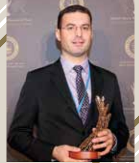
مركز دراسات الفساد والديمقراطية - كورد فرنسا / كندا (البحث والمواد التعليمية الأكاديمية)