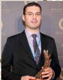
Center for the Study of Corruption and Democracy - CORDE

France/Canada (Academic Research and Education)