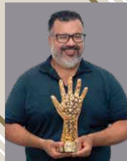
Instituto OPS Brazil (Innovation/Investigative Journalism)