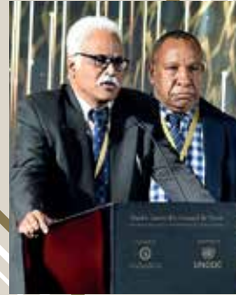
Phones Against Corruption (PNG)

Papua New Guinea (Innovation/Investigative Journalism)