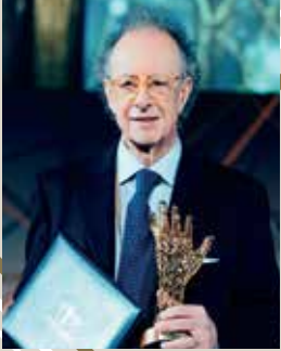
Prof. Gherardo Colombo

Italy (Lifetime/Outstanding Achievement)