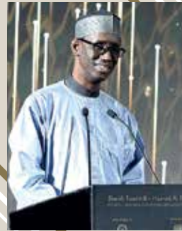
Mallam Nuhu Ribadu

Nigeria (Lifetime/Outstanding Achievement)