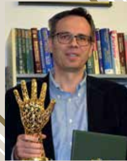
Center for the Study of Democracy (CSD) Bulgaria (Youth Creativity and Engagement)