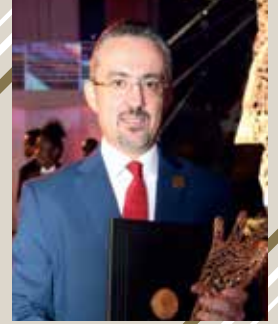
الدكتور / ألبان كوشي ألبانيا (البحث والمواد التعليمية الأكاديمية)