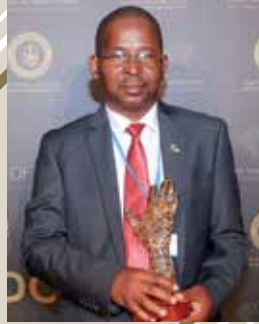
تي إم ميوزيك تنزانيا (جائزة إبداع الشباب وتفاعلهم)