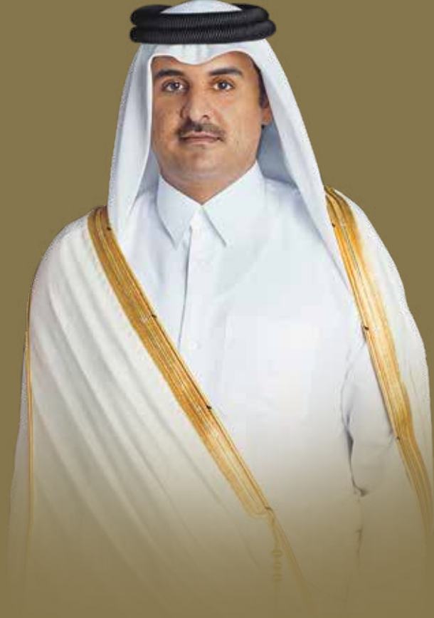
حضرة صاحب السمو الشيخ تميم بن حمد آل ثاني أمير البلاد المفدى