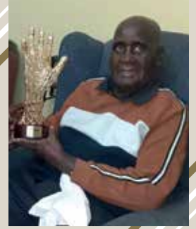
سعادة السيد / كينيث كوندا زامبيا (إنجاز العمر / والإنجاز المتميز)