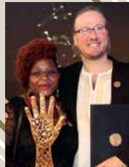
Jeunesse Musicales Internationales