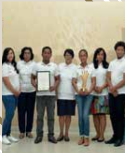
ONG Tolotsoa Madagascar (Youth Creativity and Engagement)