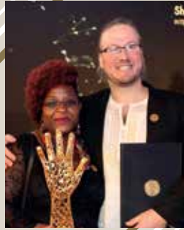
موسيقى جونيس الدولية بلجيكا (إبداع الشباب و تفاعلهم)